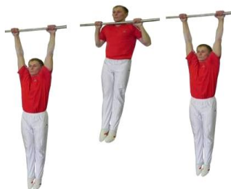
Рисунок 1 – Подтягивание на перекладине

Запрещается выполнение движений рывком и махом.