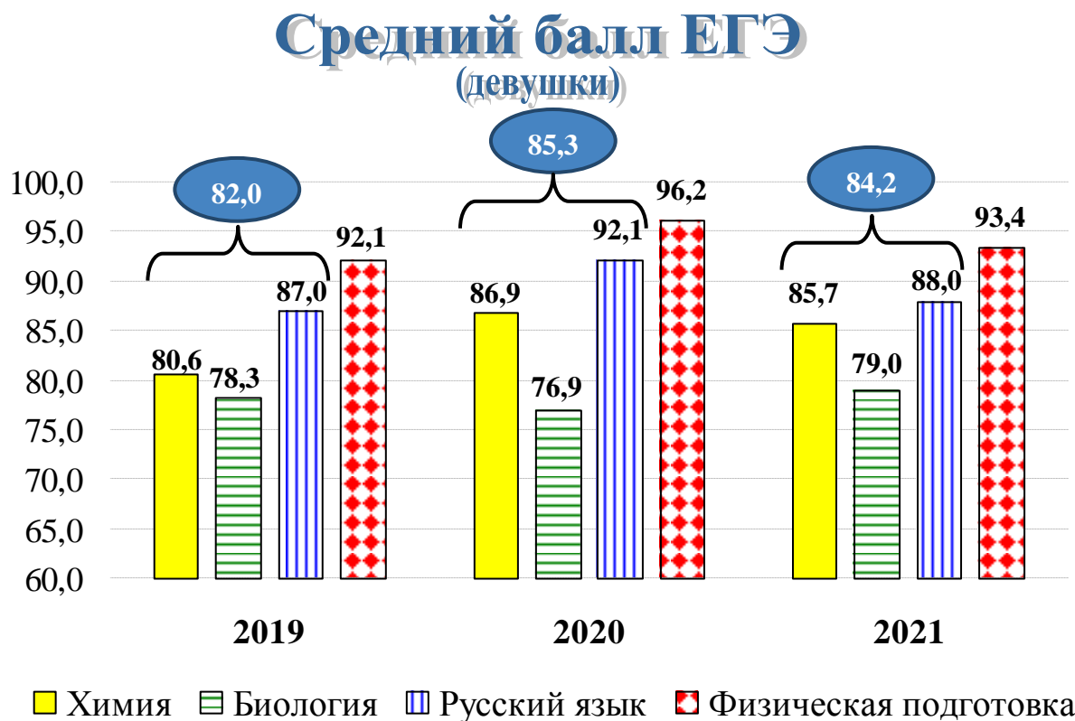
Рисунок 2 – Средние баллы по ЕГЭ и физподготовке у девушек, поступивших в академию в 2019 – 2021 годах

У зачисленных на обучение девушек отмечался высокий уровень физической и общеобразовательной подготовленности (см. Рисунок). Их средние показатели по вступительным испытаниям устойчиво сохраняют более высокие уровни, чем у юношей, и превышают уровень 80 баллов. Из числа зачисленных в 2021 году на обучение девушек около 60 % окончили школу или колледж с отличием.